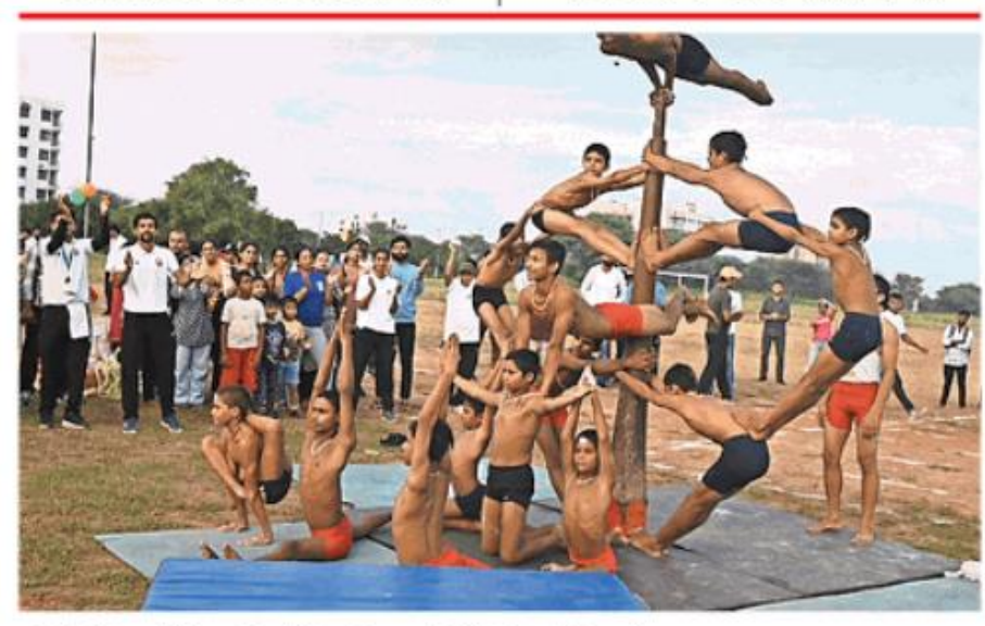
हकेवि में आयोजित प्रतियोगिता में प्रस्तुति देते विद्यार्थी 🌑 सौ. प्रवक्ता

राष्ट्रीय खेल दिवस के उपलक्ष्य में कई खेलों के आयोजन किए गए